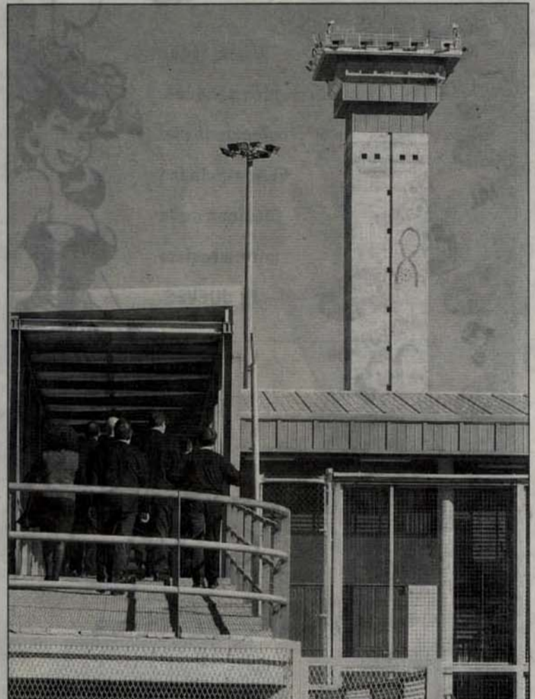
Varias personas cruzan por la pasarela de la prisión salmantina.

dentro del centro. Sin embargo, los terroristas afectados se negaron al traslado, alegando que sólo accederán al mismo si también resultan beneficiados los otros tres miembros de la banda armada reclusos en celdas de aislamiento.