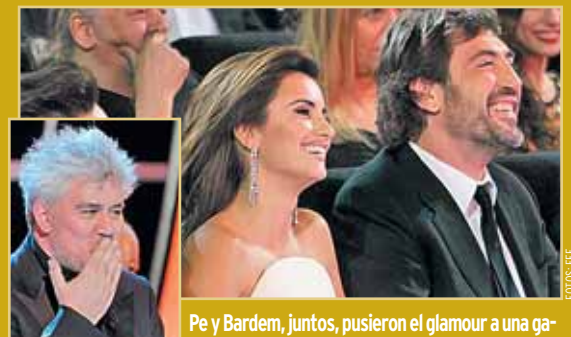
Pe y Bardem, juntos, pusieron el glamour a una gala que acabó con sorpresa: la vuelta de Almodóvar.

Luis Tosar, ganador del Goya por 'Celda 211'.