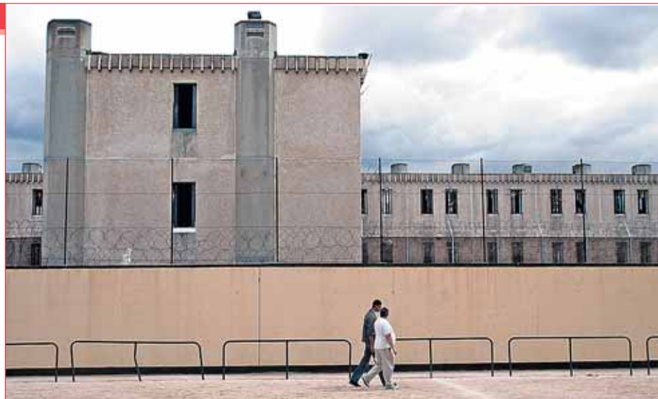
La radiografía de las cárceles españolas en www.que.es

Más de tres de cada diez presos son extranjeros. Según el secretario de Estado de Seguridad, Antonio Camacho, el Ministerio de Interior lleva mucho tiempo trabajando en proponer a los presos la opción de la extradición, pero apenas un 20% de los extranjeros lo acepta y no se plantea la posibilidad de que deje de ser voluntario.