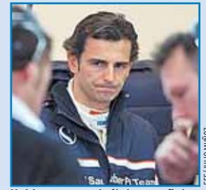
Hablamos con el piloto español.

PEDRO DE LA ROSA: "AHORA SOY MEJOR PILOTO" Pág. 10