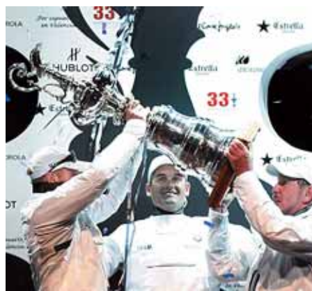
La Jarra de las Cien Guineas vuelve a los Estados Unidos.

con los barcos que han decidido unos jueces en Nueva York. El BMW-Oracle, el equipo que no aceptó el Desafío Español, no dio opción al Defensor, el Alinghi suizo. Pág. 4